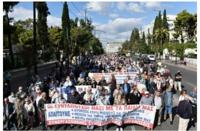
Στιγμιότυπο από το μεγάλο παναττικό συλλαλητήριο των Συνεργαζόμενων Συνταξιοϋχικών Οργανώσεων στις 5 Οκτωβρίου στην Αθήνα

πολύ καλά ότι η ΕΚΤ και η ΤτΕ έχουν βάλει φαρδιές πλατιές τις υπογραφές τους σε όλα τα μνημόνια και τις εν γένει αντιλαϊκές πολιτικές που εφαρμόζονται.