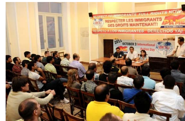
Ο Βαλεντίν Πατσο, Αναπληρωτής ΓΓ της ΠΣΟ μιλά σε συγκέντρωση μεταναστών στα γραφεία του Συνδικάτου Εμποροϋπαλλήλων