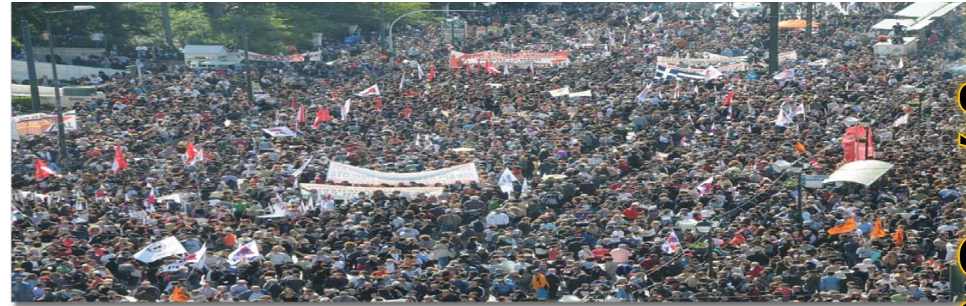
Αθήνα, 20 Οκτώβρη

ταξικής πάλης. Βασικά στοιχεία των νέων συνθηκών είναι η δραματική επιδείνωση της ζωής της εργατικής τάξης. Παράλληλα το αστικό πολιτικό σύστημα περνάει μεν κλονισμούς, αλλά προετοιμάζει εναλλακτικά σχέδια για τη διάσωσή του. Αυτά τα σχέδια προϋποθέτουν το χτύπημα του ταξικού κινήματος, την τρομοκράτηση των εργαζομένων και τον εγκλωβισμό της λαϊκής δυσαρέσκειας στα πλαίσια του συστήματος. Σε αυτήν την κατεύθυνση ήταν τόσο η πρόταση για Δημοψήφισμα, όσο και η συγκρότηση της κυβέρνησης συνεργασίας σοσιαλδημοκρατών-φιλελευθέρων-εθνικιστών. Αυτούς τους σκοπούς εξυπηρετούσε και η δολοφονική επίθεση των κουκουλοφόρων στην εργατική διαδήλωση της 20 ης Οκτωβρίου. Σε αυτό το πλαίσιο το ΠΑΜΕ αγωνίζεται για την ανασύνταξη του εργατικού συνδικαλιστικού κινήματος. Η επιτυχία αυτού του στόχου θα εξαρτηθεί σε σημαντικό βαθμό από την εξέλιξη του αγώνα για την οργάνωση και ενεργητική συμμετοχή της εργατικής τάξης κατά κλάδο, εργοστάσιο, τόπο δουλειάς και την απαλλαγή