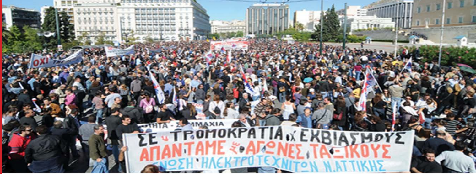
Η διαδήλωση του ΠΑΜΕ μπροστά από την Βουλή, 20 Οκτώβρη