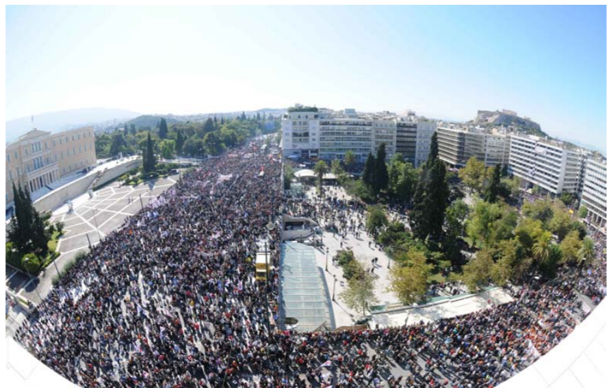
Αθήνα, 20 Οκτώβρη

Με την επιτυχημένη ολοκλήρωση της 48ωρης μπαίνουμε σε νέα φάση της