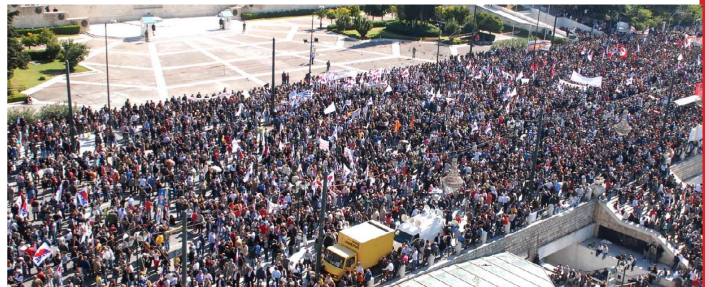
Athens, October 20 th

ήδη 5 ώρες γύρω από τη Βουλή, ομάδα κουκουλοφόρων που κουβαλούν πέτρες, ρόπαλα, βόμβες μολότοφ, πυροσβεστήρες και άλλο οπλισμό που διαθέτει μόνο η αστυνομία, όπως δακρυγόνα και χειροβομβίδες κρότου λάμψης, κινείται ανενόχλητη από την αστυνομία, μέχρι που φτάνει στις παρυφές της συγκέντρωσης του ΠΑΜΕ. Εκεί επιτίθενται στο συγκεντρωμένο πλήθος, έχοντας