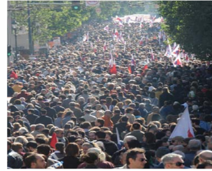
Αθήνα, 19 Οκτώβρη

Η διαδήλωση του ΠΑΜΕ στην Αθήνα κράτησε πάνω από 5 ώρες, κυριεύοντας το κέντρο της Αθήνας με συνθήματα,