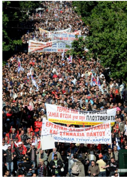
Αθήνα, 20 Οκτώβρη

ΠΑΜΕ ολοκληρώνει συγκροτημένα την διαδήλωση στην Ομόνοια, όπου με ομιλία της Ε.Γ. του ΠΑΜΕ χαιρετίζει τους απεργούς «Σήμερα, δώσαμε όλοι μαζί μια μάχη δυναμική, μια μάχη αποφασιστική. Σκληρή απάντηση δώσαμε στην κυβέρνηση, στα κόμματα της πλουτοκρατίας, στην εργοδοσία και τη δώσαμε στους τόπους δουλειάς, στους δρόμους.