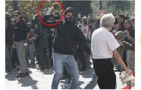
Προβοκάτορας επιτίθεται σε διαδηλωτή

Αυτή η επίθεση αποτελεί μέρος σχεδίου ενάντια στο λαϊκό κίνημα, το οποίο κλιμακώνεται και θα έχει συνέχεια. Πρόσφατα είναι τα παραδείγματα της δολοφονίας 3 εργαζομένων στην απεργία της 5/5/10 αλλά και τα συνθήματα που καλλιεργούνταν στις συγκεντρώσεις των «αγανακτισμένων» -ΕΞΩ ΤΑ ΚΟΜΜΑΤΑ, ΕΞΩ ΤΑ