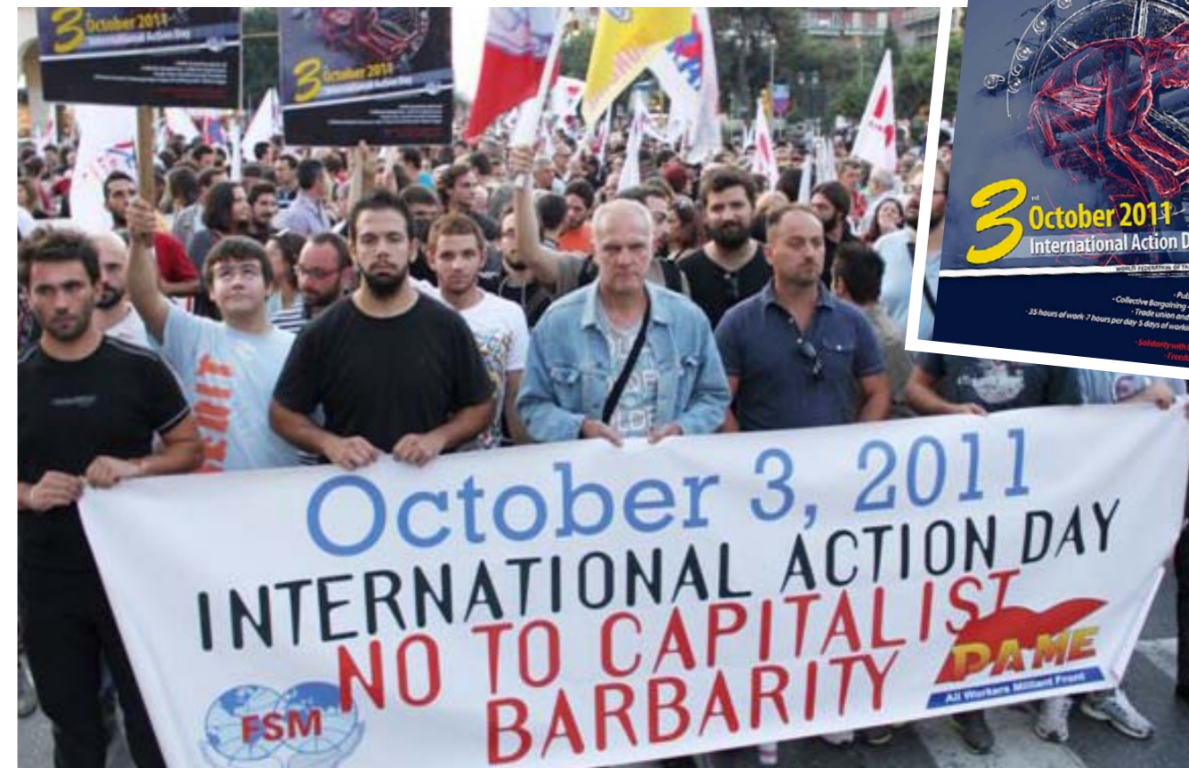
Διαδήλωση στη Θεσσαλονίκη, 3 Οκτώβρη